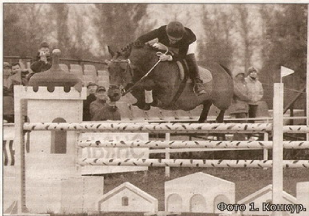
Фото 1. Конкур.

Конный спорт делится на два основных направления: испытания и классические виды конного спорта. К испытаниям относятся бега, скачки и соревнования троек, которые проводятся среди лошадей определенных возрастных групп на ипподромах. К классическим видам спорта относятся конкур, выездка, троеборье, драйвинг, плейджи и вольтижировка.