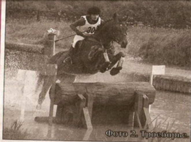
Фото 2. Тросборье.