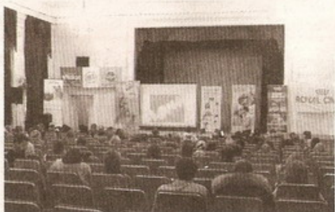
Семинар Гильдии практикующих ветеринарных врачей Республики Татарстан по офтальмологии мелких домашних животных

По итогам форума вузам поручено вести дополнительную работу по информированию студентов, молодых специалистов о возможностях, которые предоставляет государство по развитию собственного бизнеса, в т.ч. в рамках нового проекта – «начинающий фермер».