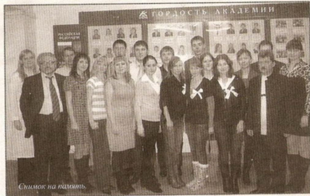
Снимок на память.