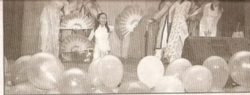
Мелодии Африки сменяются мотивами Азии...И всем хорошо!