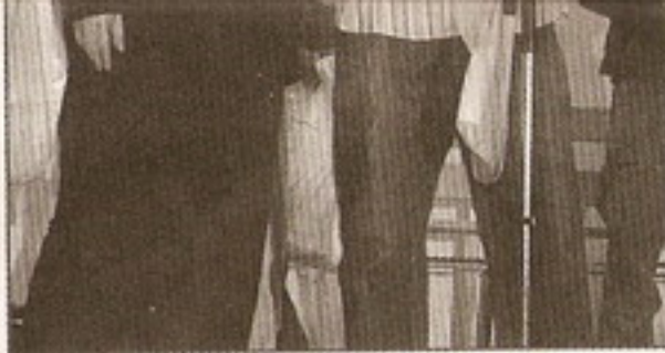
И проректору захотелось сфотографироваться с мастером африканских экзотических жанров!