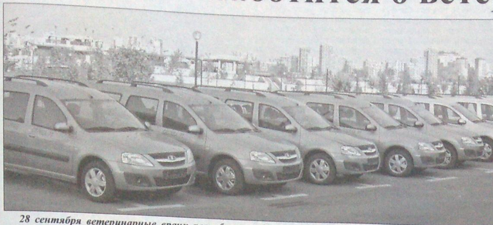
28 сентября ветеринарные врачи республики получили ключи от автомашин «Лада Ларгус».

От имени Президента РТ ключи вручил заместитель премьер-министра – министр сельского хозяйства