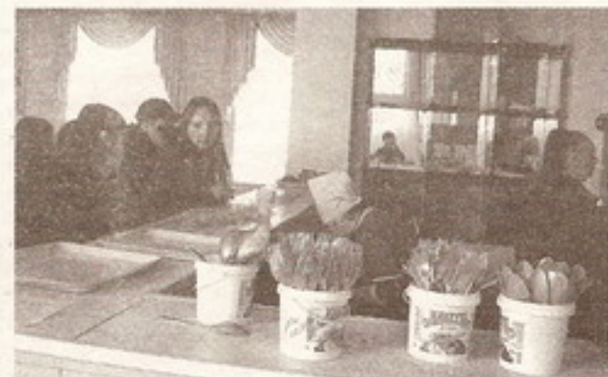
«Готовые к бою, орудия в ряд На солнце зловеще сверкают...»