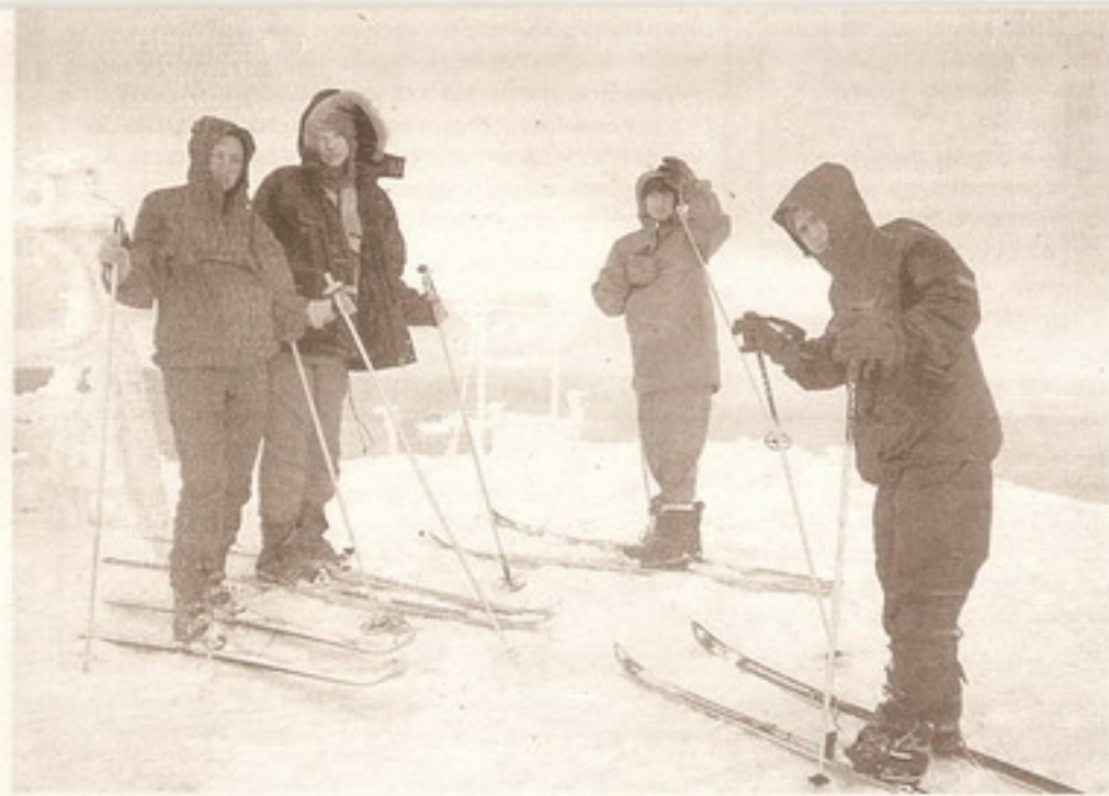
Теплый взгляд в сторону родной академии с отрогов Южного Урала.