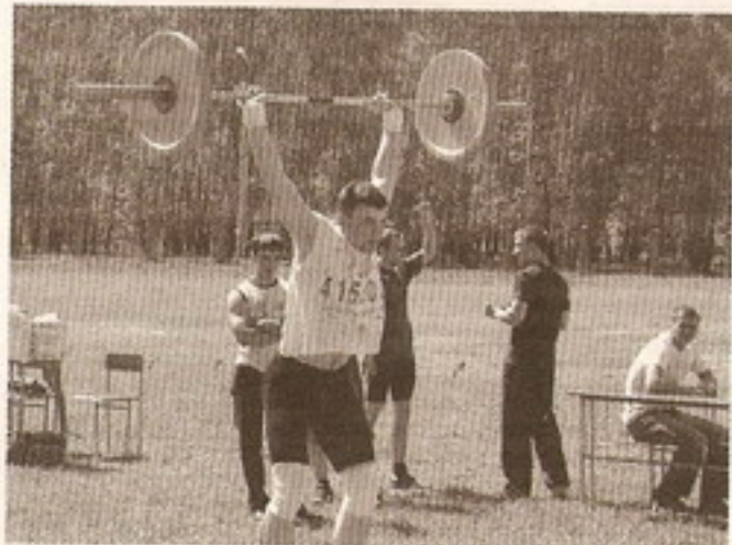
Штангисту и гиревнику тоже нужно умение, но главное — сила, альпинисту и по столбу, но только бы вверх.