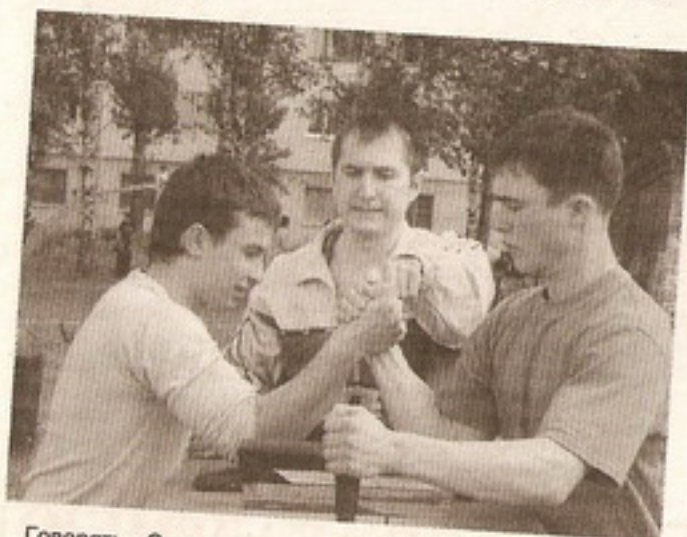
Говорят: «Сила солому ломит». Но где же эта самая солома?