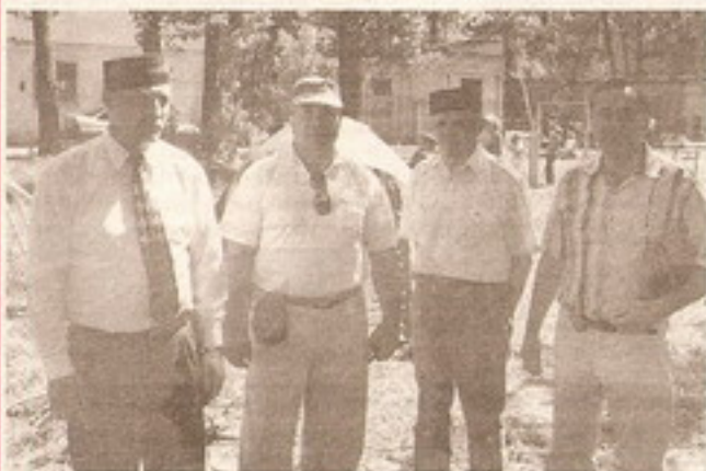
Судьи настроены серьезно...

А на другом конце футбольного поля борьбу за первенство вели гиревики, классические борцы и, конечно, борцы на поясах... Каких только видов спорта не было на празднике! Это и футбол, и волейбол, и даже альпинисты с туристами разбили свой небольшой лагерь, сварили кашу и угостили всех желающих.