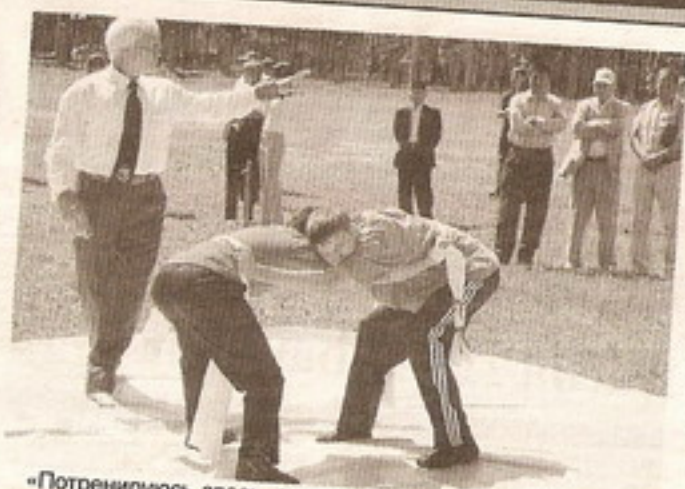
«Потренируюсь здесь, а потом в районе за победу наградят бараном».