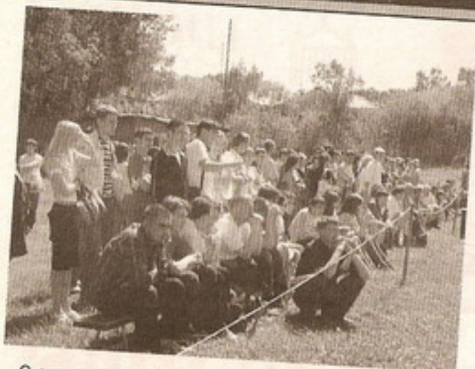
С затаенным вниманием ждут зрители исхода в каждом состязании.