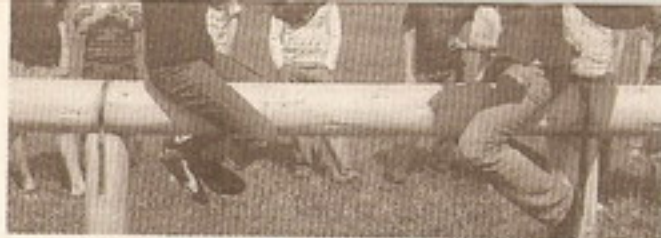
Здесь уж не столько сила нужна, сколько ловкость и умение увернуться.