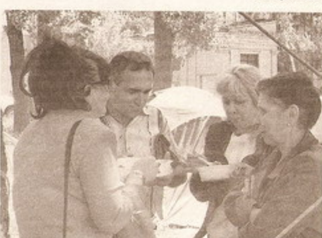
Хороша каша туриста.