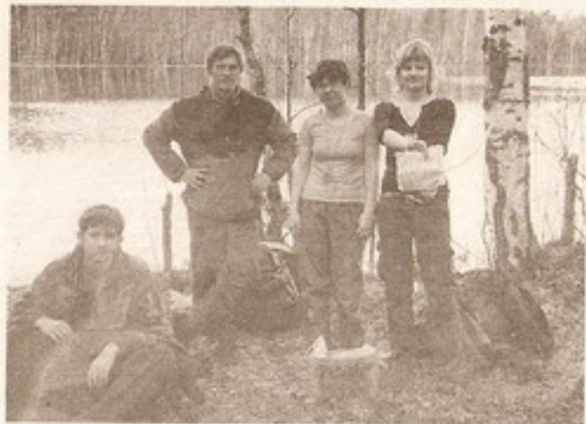
На берегу Серебряного озера.