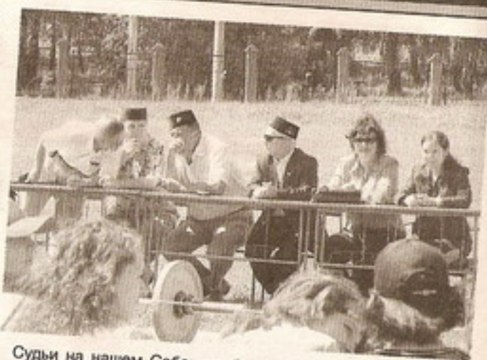
Судьи на нашем Сабантуе были строгие, но добрые.