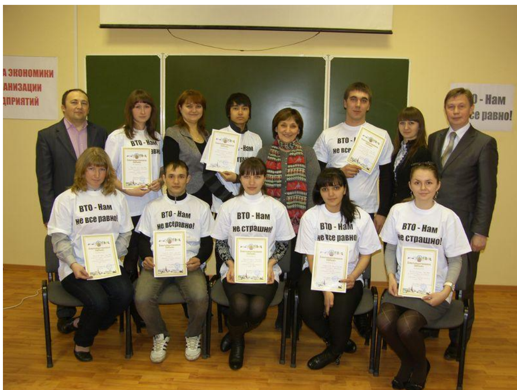
2012 год. Студенческая научно-практическая конференция «Экономика, торговая политика и право ВТО»