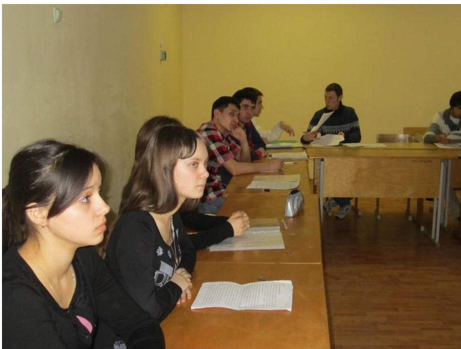
2013 год. Круглый стол «Законодательство, регулирующее аграрный рынок»