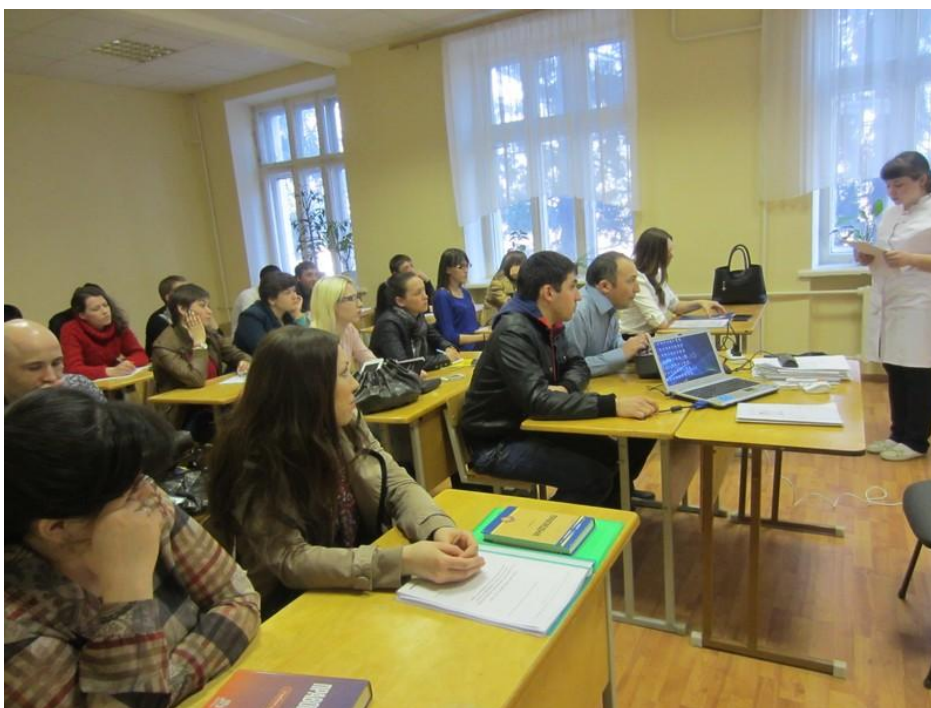
2014 год. Круглый стол «Просто о важном: основы конституционного и гражданского права»