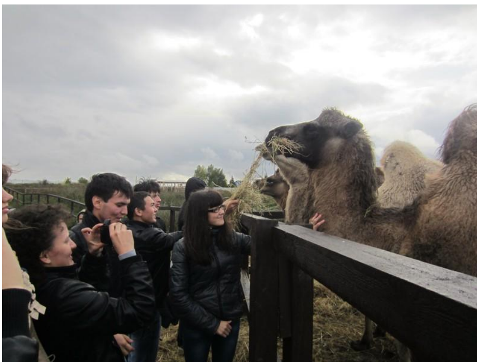
2013 год. КФХ «Лайдэя» Лаишевский район.