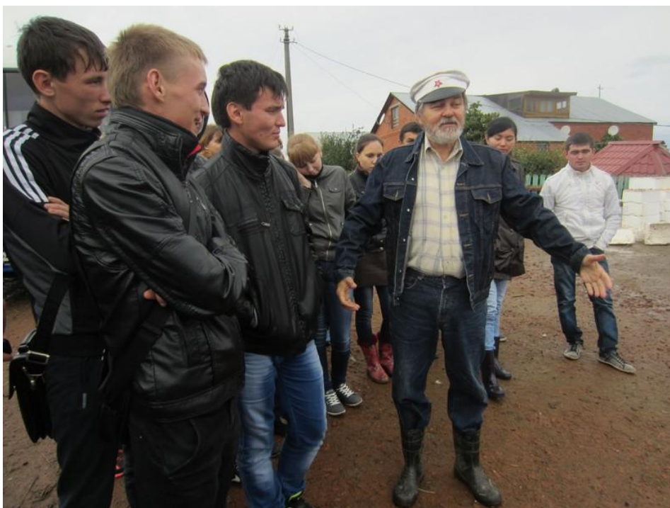
2013 год. КФХ Сиразин (Верхнеуслонский район)