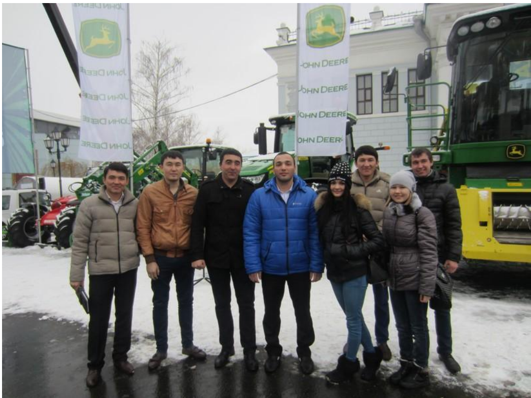
2014 год. Специализированная выставка «Агрокомплекс: Интерагро.Анимед. Фермер Поволжья».