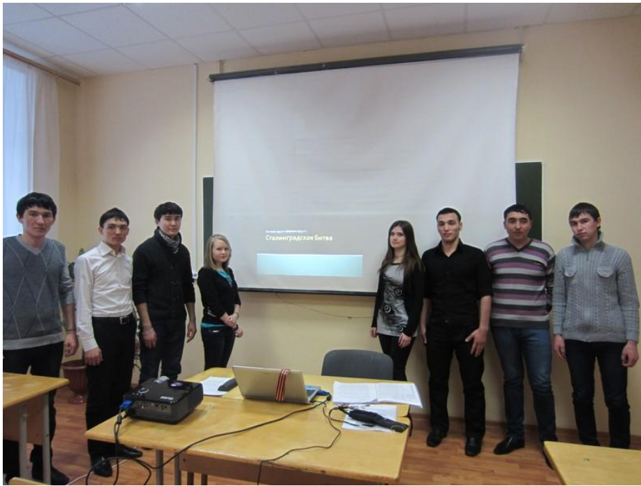
2013 год. К 70-летию разгрома немецко-фашистских войск под Сталинградом.