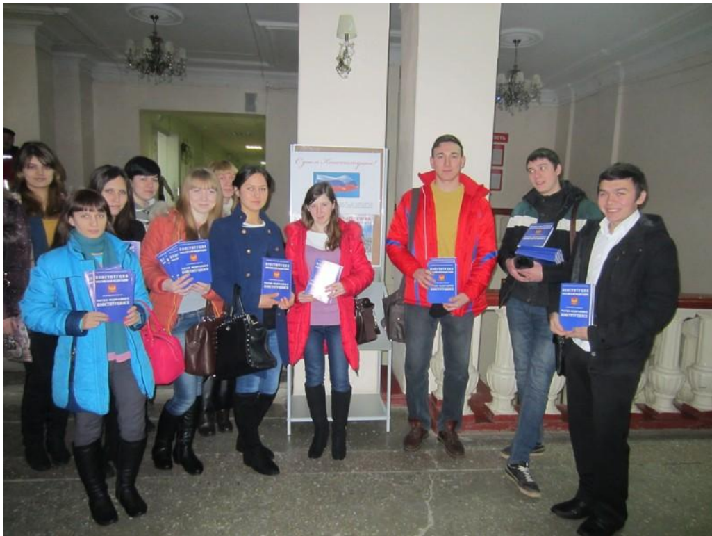
2013 год. Мероприятия, посвященные 20-летию Конституции России.