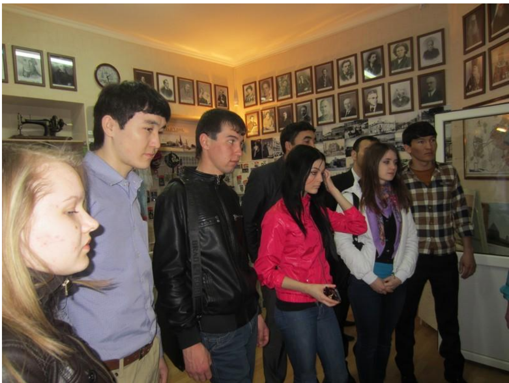
2013 год. Казанский Кремль. Экскурсия.

Организуются выездные занятия, экскурсии на предприятия Республики Татарстан для обобщения теоретического материала и применения его на практике.