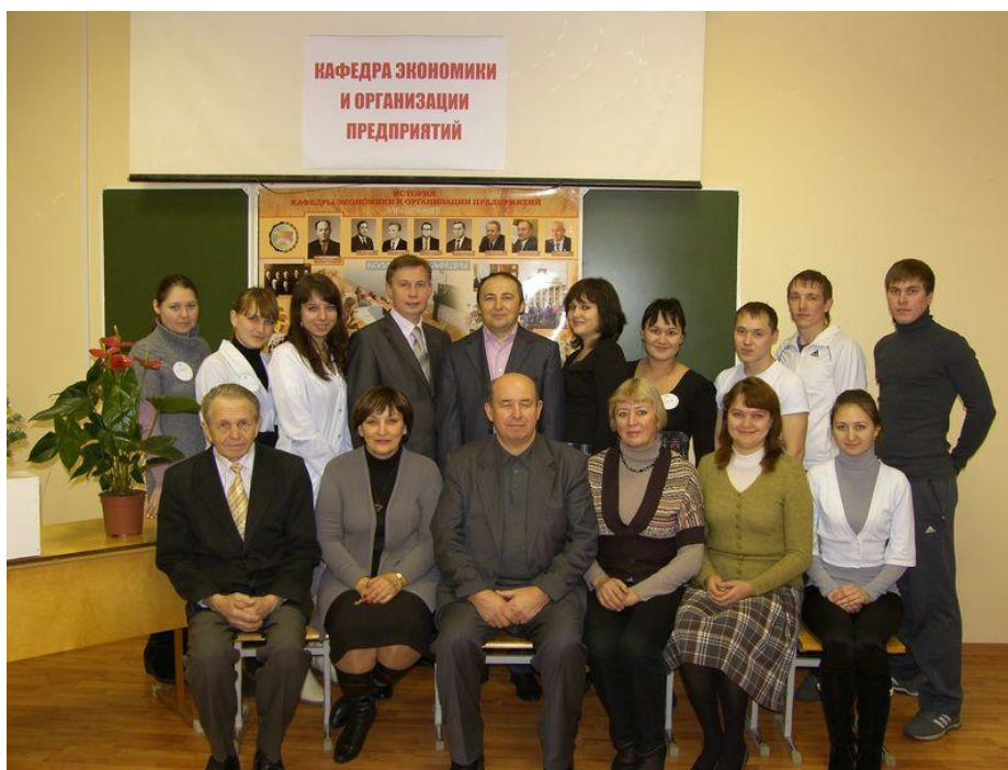
2012 год. День кафедры экономики и организации предприятий

Традиционно кафедра экономики и организации предприятий отмечает свой день с привлечением студентов академии. На этом мероприятии идет разговор об истории кафедры, известных ученых и предпринимателях, которых выпустила кафедра. Затем студенты и преподаватели играют в интеллектуальные игры; завершается мероприятие совместным чаепитием.