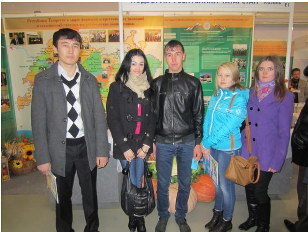
2012 год. Поволжский агропромышленный форум. Участие в круглом столе «ВТО и сельское хозяйство: реальность и перспективы»