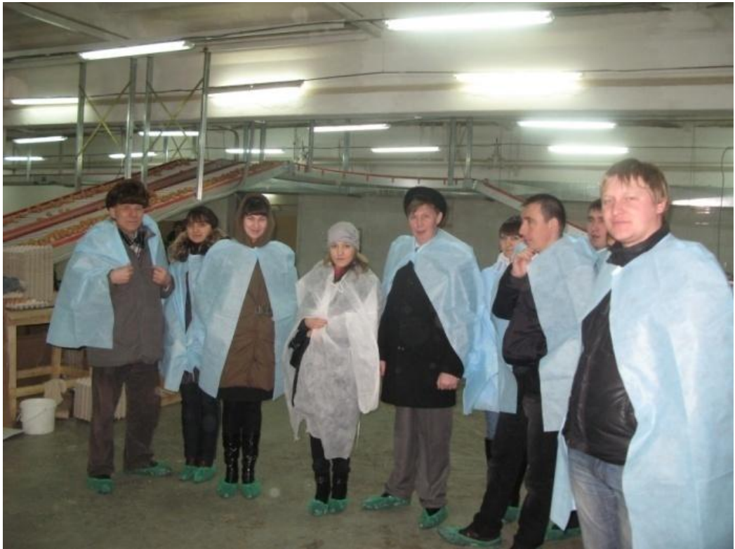
2011 год. Птицефабрика «Юбилейное» Лаишевский район.