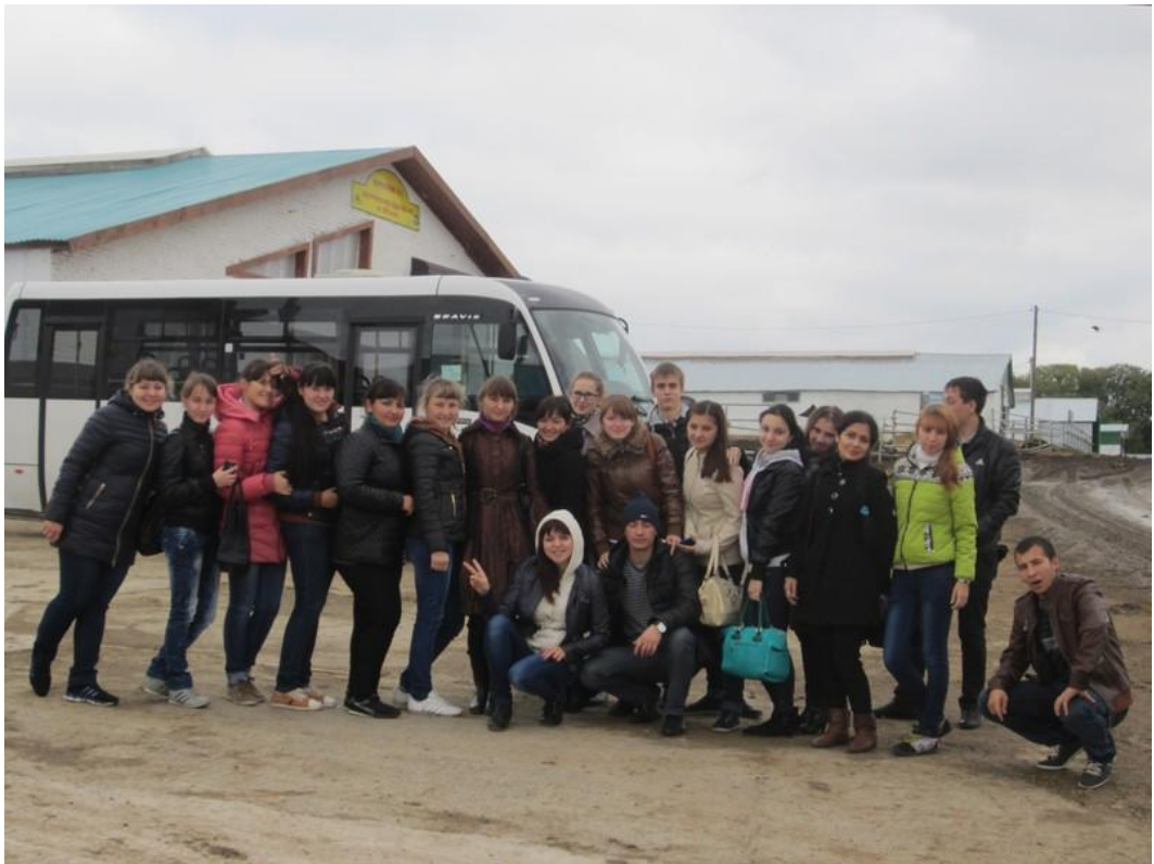
2013 год. «Ак Барс Пестрецы», Пестречинский район.