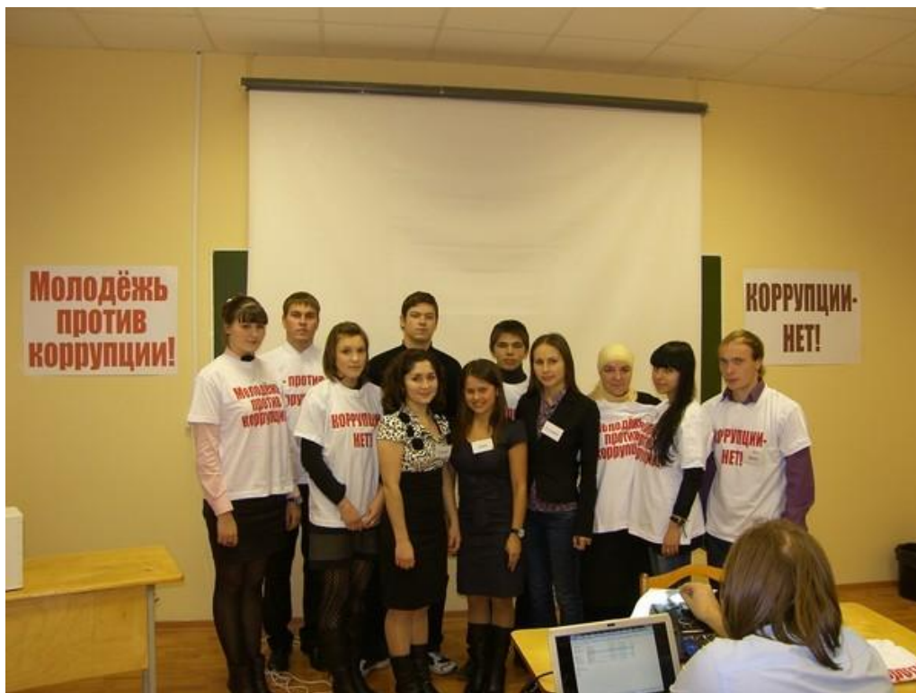
2011 год. Предметная конференция по правоведению «Противодействие коррупции в России и за рубежом»

Ежегодно на кафедре проводятся студенческие научно - практические конференции, где студенты выступают с докладами на интересующие их научные темы. До выступления студенты совместно с преподавателями кафедры готовят материалы выступлений. На кафедре проводятся различные круглые столы, деловые игры. После чего выставляются на сайте академии итоги работы, вручаются грамоты и ценные подарки.