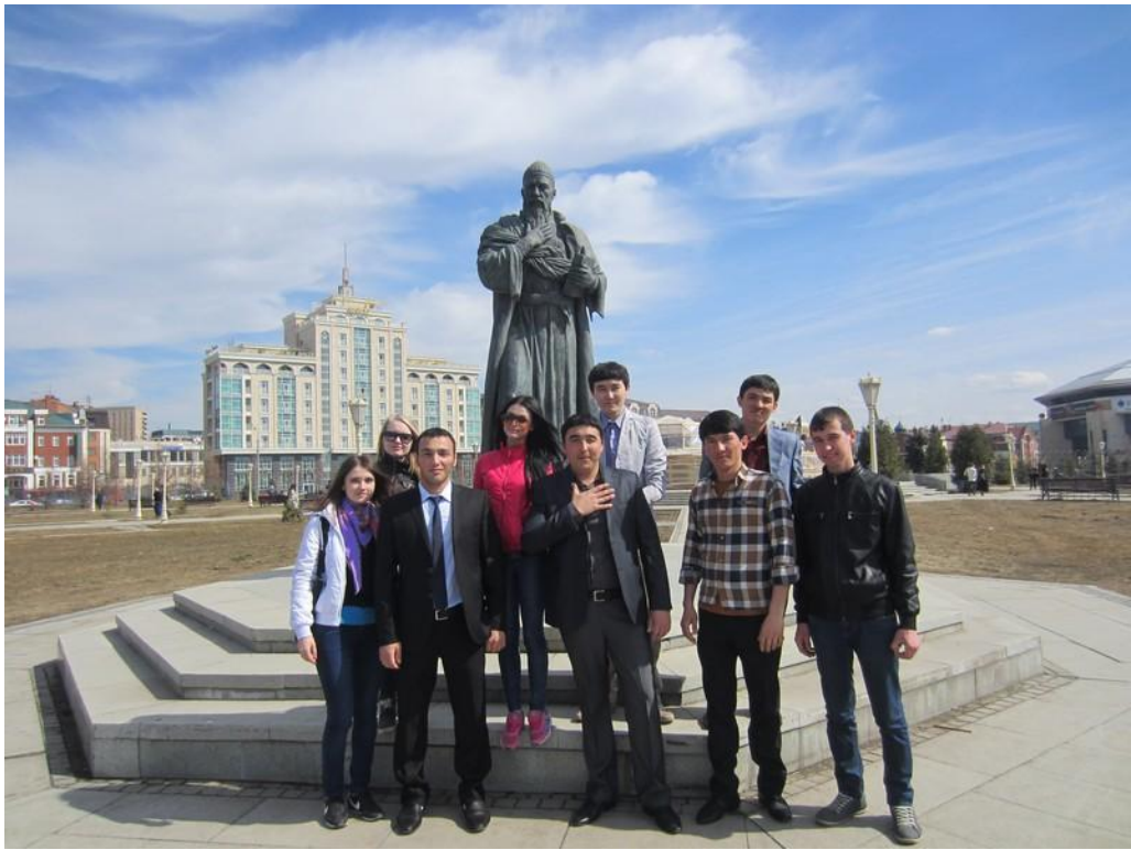
2013 год. Экскурсия по городу Казани