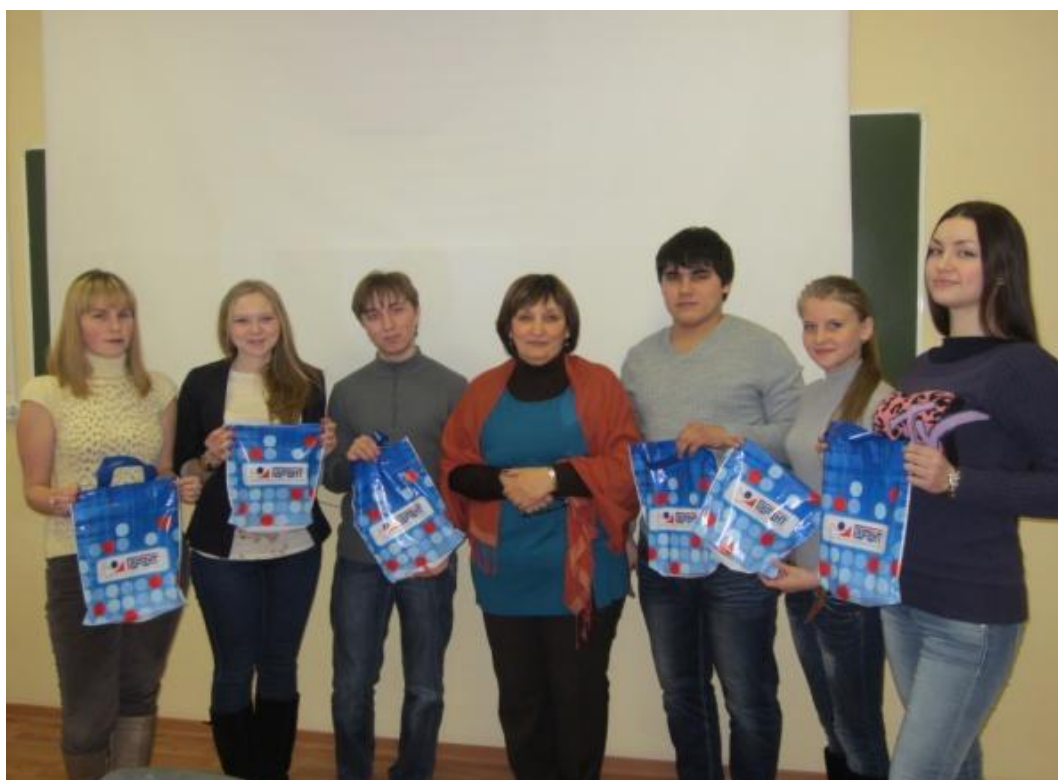
2013 год. Круглый стол по административному праву.